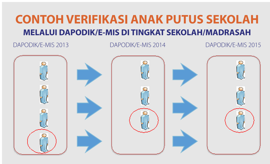
Gambar 3. Menjaring Anak Tidak Sekolah Melalui Dapodik/E-MIS