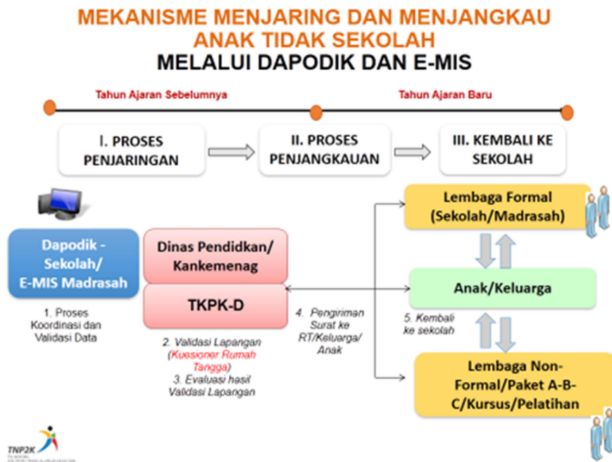
Gambar 2. Alur Diagram Mekanisme Penjangkarian Anak Tidak Sekolah Menggunakan Data Awal dari Dapodik dan E-MIS

Proses penjangkarian anak tidak sekolah diawali dengan TKPK Daerah berkoordinasi dengan Dinas Pendidikan atau Kankemenag tingkat Kabupaten/Kota serta Sekolah/Madrasah untuk: