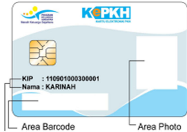
Kartu PKH Baru (2013)