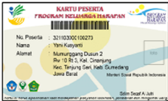
Kartu PKH Lama (2007 - 2012)